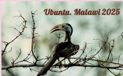
Ubuntu. Malawi 2025

Ante el aumento de conflictos, guerras y matanzas propias de la Edad Media, los más indefensos son siempre las víctimas. Por eso nuestro tradicional calendario quiere ser una pincelada de esperanza.