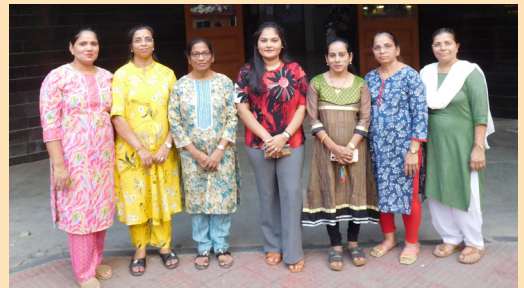
Maestras de apoyo para las niñas como parte del proyecto de Wawitai en ANKUR.

En la escuela St. Anne's School, en el barrio vecino de Borivli, nos dan la seguridad de que están recibiendo una formación sólida y también obtienen buenos resultados escolares. Cuando terminan la escuela secundaria, se les ayuda a elegir una carrera o se les prepara para un buen trabajo según sus aptitudes para que el día de mañana sea un día más brillante para ellas. "Si educas a un hombre, educas a una persona", solía decir Indira Gandhi, "pero si educas a una mujer, educas a una familia".