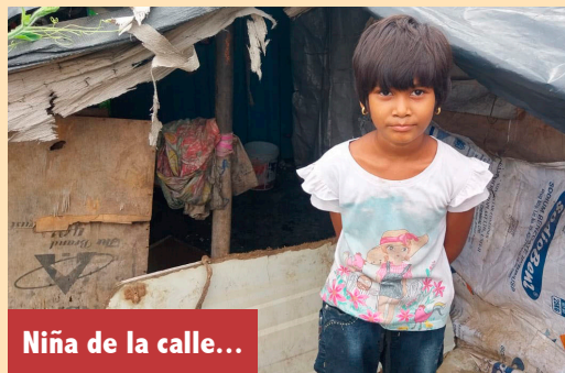
Niña de la calle...

Eran recolectoras de basura, hoy tienen un trabajo y pueden ayudarse a sí mismos y a sus familias también. Nosotras, la Comunidad de Hermanas de la Caridad de Santa Ana que estamos en Ankur . nos sentimos orgullosas y privilegiadas de poder cuidarlas y servirles. Nuestra vida diaria se dedica a ayudar a estas niñas y a sus familias en sus problemas.